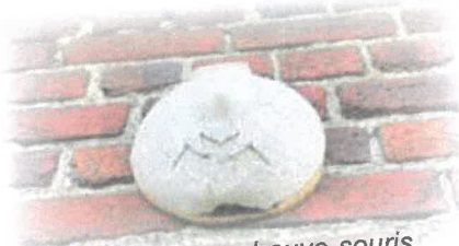
Refuge pour chauve-souris

Nous venons de recevoir le résultat de notre démarche : le cimetière de Marpent a été classé NIVEAU 1 à la labellisation «Cimetière Nature», ce qui est un EXCELLENT RÉSULTAT pour une première année.