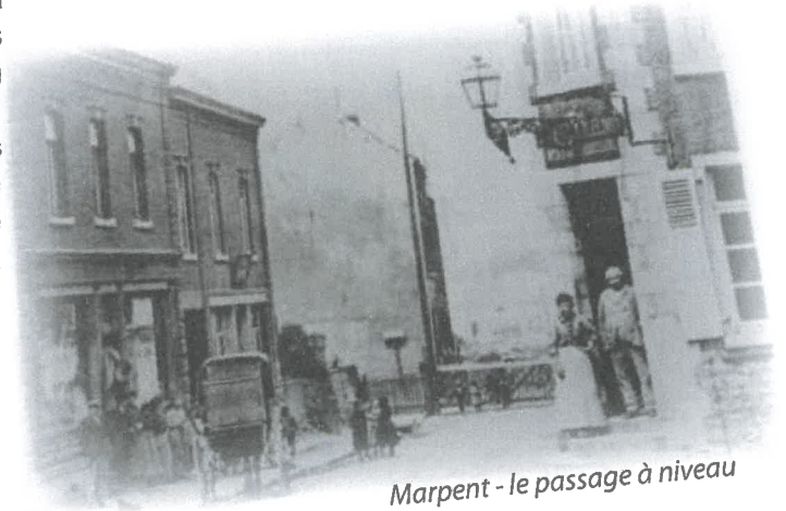
Marpent - le passage à niveau

Il faudra attendre 1953 pour que les travaux du pont de l'avenue Jouhaux commencent. Ils s'achèveront en 1958, avec la fermeture du passage à niveau et la construction du passage souterrain, devenu aujourd'hui « passage de la place ».