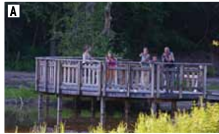
Le poste d'observation