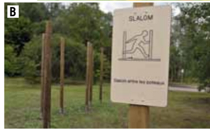
Le parcours sportif