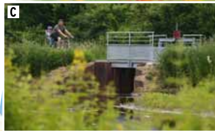
La vanne de la frayère