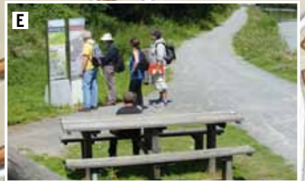
La halte pique-nique