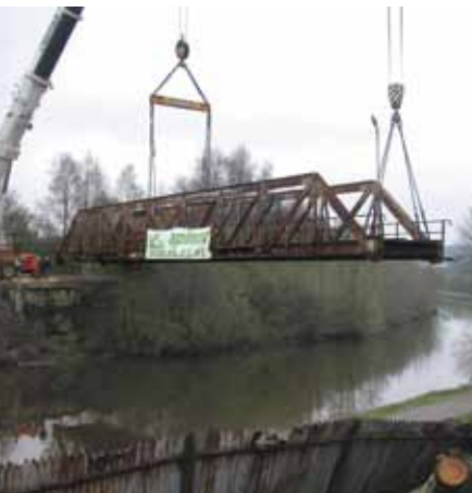
Dépose du pont ferroviaire