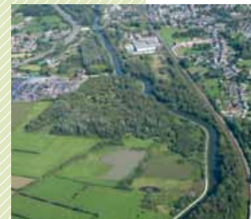
Vue aérienne du Cœur de Nature