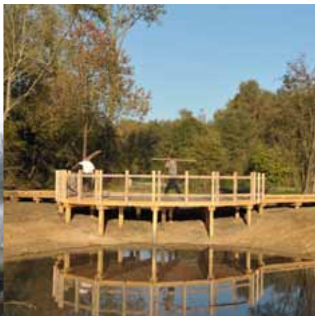
Aménagement du poste d'observation